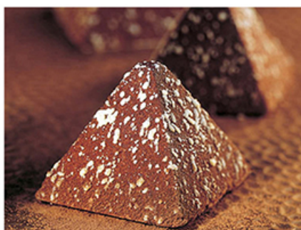
Piramide al cioccolato