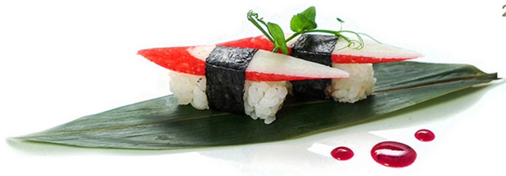
24. GRANCHIO € 2.50 🐞🍷