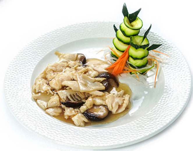
103. Pollo con funghi bambu € 5.00 🌿🌾