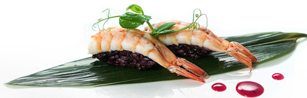
26. BLACK EBI Gamberi € 2.50 🍷