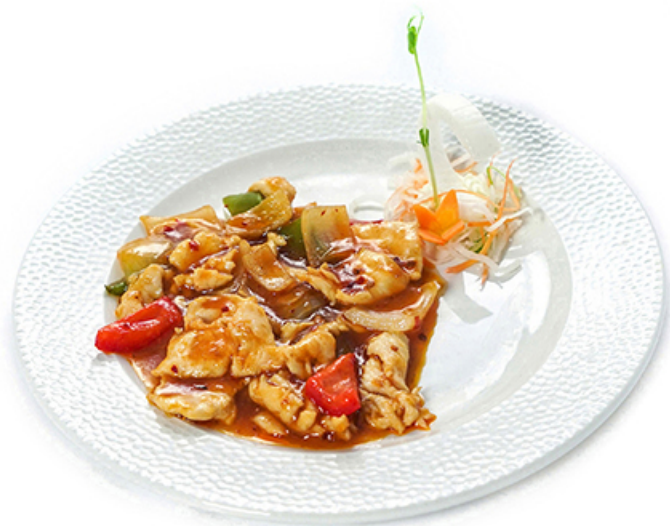
104. Pollo in salsa piccante 🌶️🌶️ Peperoni, cipolla € 5.00 🌿🌾