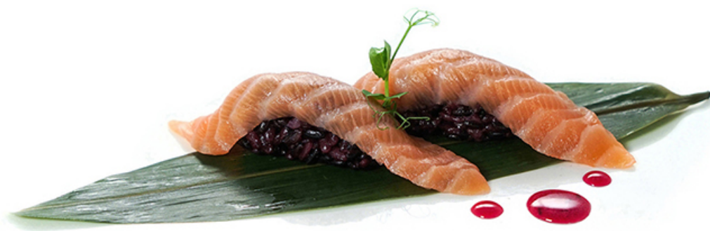
25. BLACK SAKE Salmone € 2.50 🐟