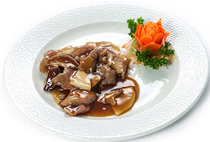
99. VITELLO CON FUNGHI E BAMBÙ