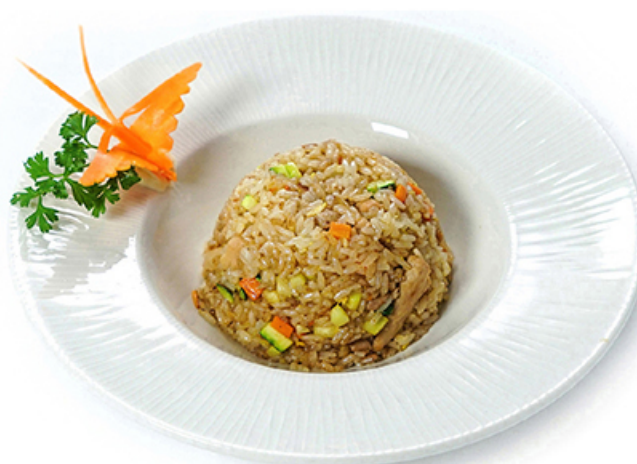
77. TORI YAKI MESHİ Uova, verdure e pollo