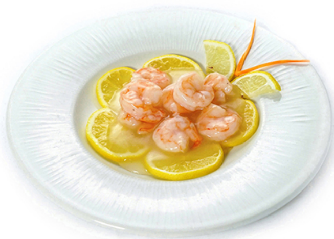
88. GAMBERI AL LIMONE