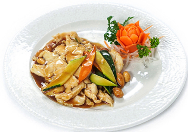
102. Pollo con mandorle Zucchine, carota, mandorle € 5.00 🌿🌾🌾