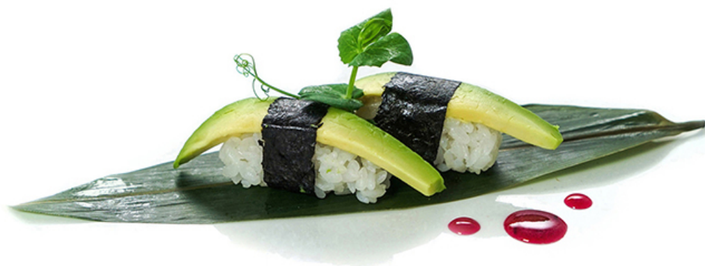
23. AVOCADO € 2.50