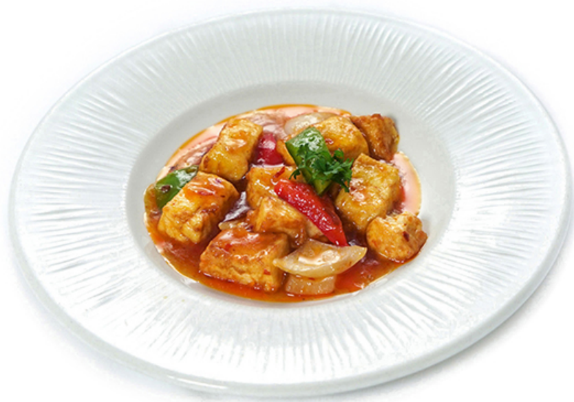
109. Tofu con verdure saltate € 5.00