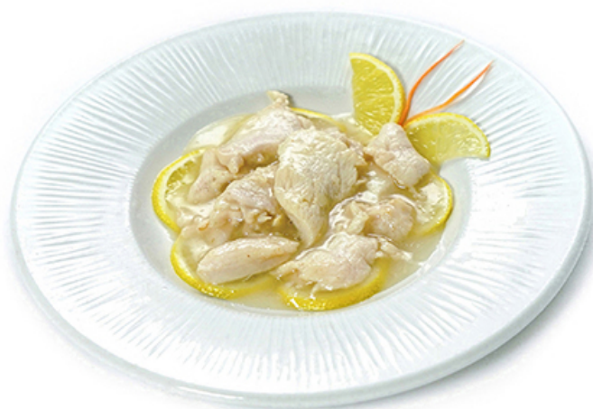
105. Pollo al limone € 5.00 🌿