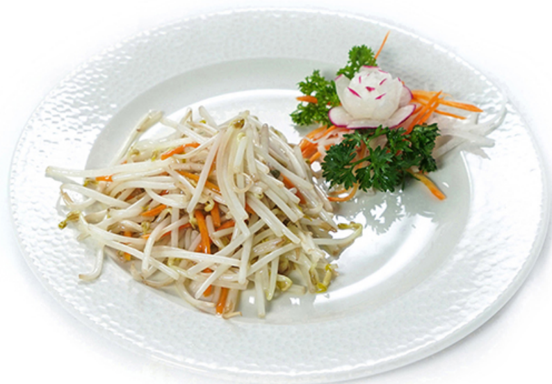
111. Germogli di soia saltati