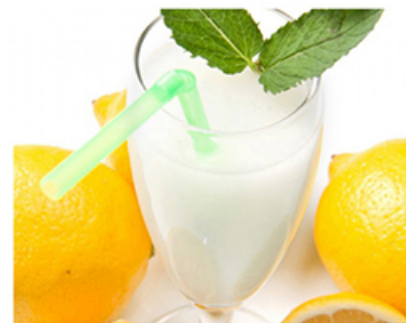
Sorbetto al limone