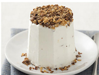
Semifreddo al torroncino