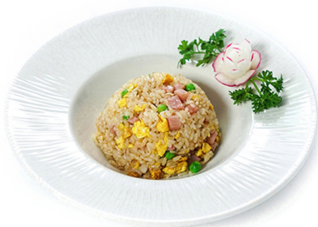
75. RISO CANTONESE Piselli, uova e prosciutto