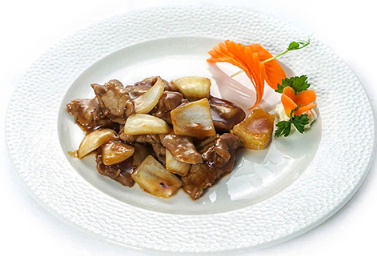
101. VITELLO CON CIPOLLA